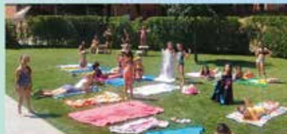
Dies de piscina