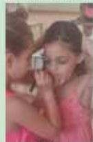
Taller de maquillatge