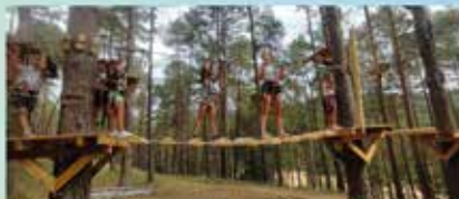
Sortides els divendres