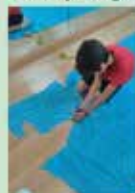
Taller de vestuari